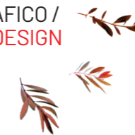
IMAGEN FESTIVAL Y DISEÑO GRÁFICO / FESTIVAL IMAGE AND GRAPHIC DESIGN

VIII FESTIVAL INTERNACIONAL DE CINE DOCUMENTAL SOBRE GÉNERO VIII INTERNATIONAL DOCUMENTARY FILM FESTIVAL ON GENDER